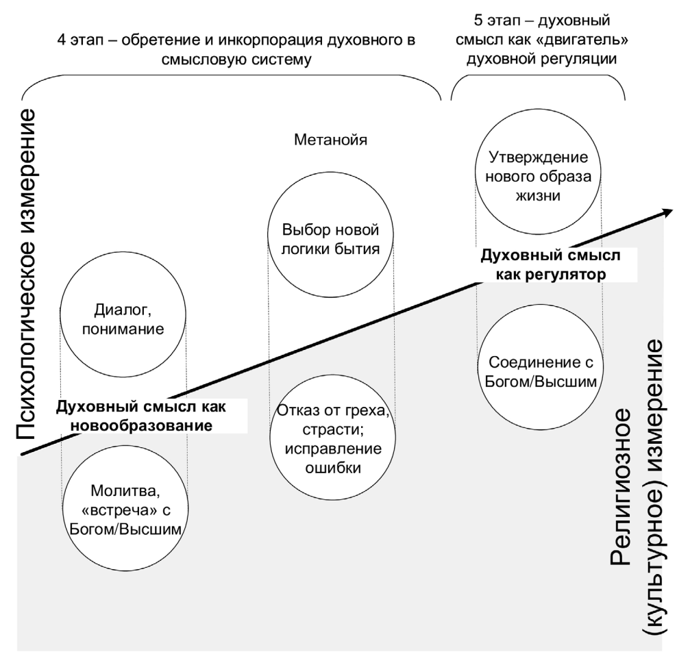
Этапы переживания духовного кризиса (этапы 4, 5)